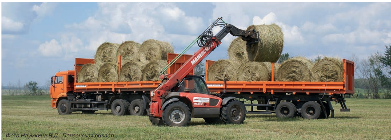
Фото Наумкина В.Д., Пензенская область