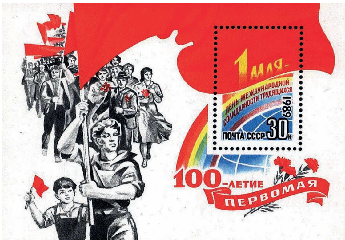
Почтовый блок СССР, 1989 год: 100-летие Первомай