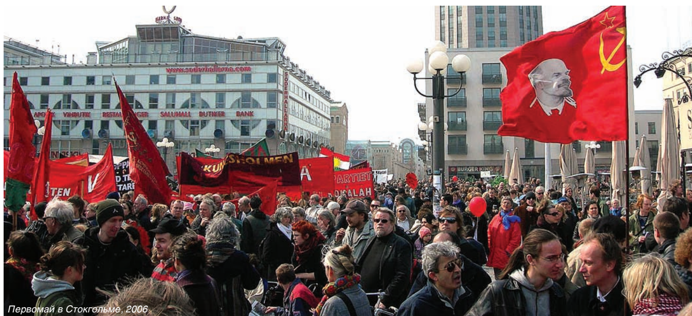
Первомай в Стокгольме, 2006