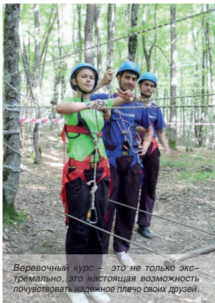
Веревочный курс – это не только экстремально, это настоящая возможность почувствовать надежное плечо своих друзей.

с традиционным занятием спорта организованы спортивные соревнования в рамках «Дня борьбы с вредными привычками».