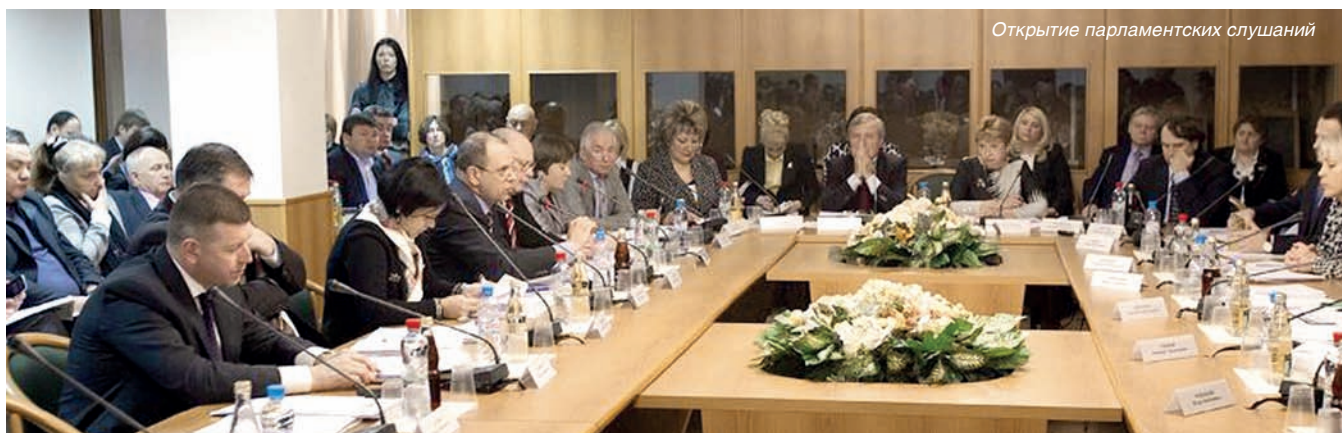
Открытие парламентских слушаний