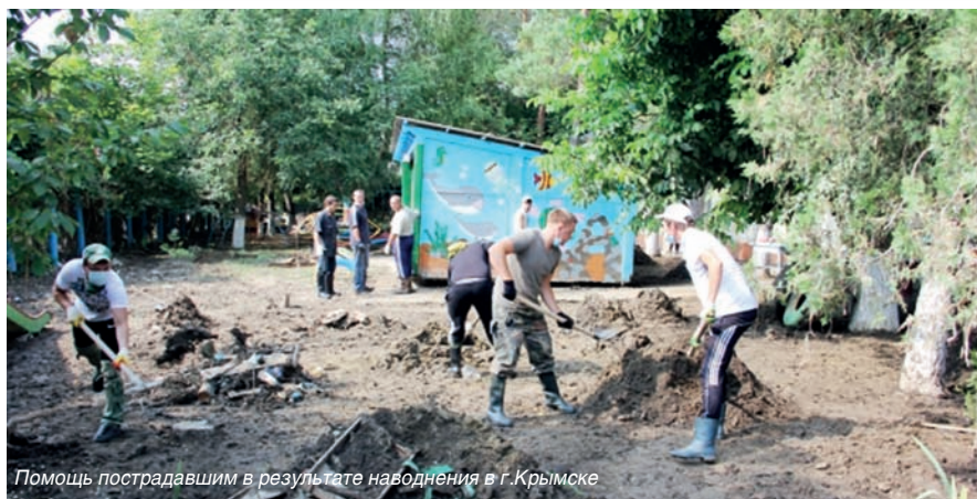
Помощь пострадавшим в результате наводнения в г.Крымске

Большое внимание профкомом уделяется материальной поддержке членов Профсоюза. Ежемесячно по ходатайству профкома выделяются материальные средства студентам, рабочим и служащим. Размер помощи составляет от 500 рублей до 5000 рублей. Каждый месяц помощь из числа студентов получают более тысячи человек.