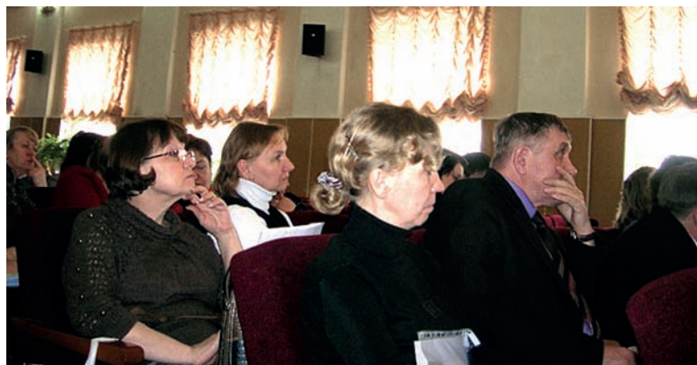
Участники заседания областного комитета Профсоюза

— Я хочу привести высказывание Президента из его Послания: «В течение 3-4 лет Россия должна за счет собственного произ-