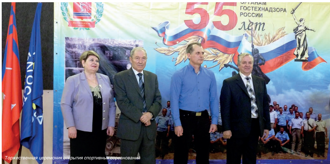
Торжественная церемония открытия спортивных соревнований