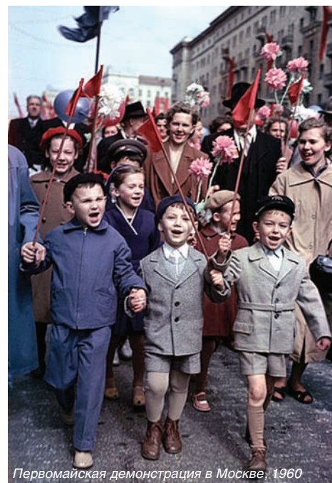
Первомайская демонстрация в Москве, 1960

Первомай – другие названия: День труда, День весны, Праздник весны и труда (в РФ), День международной солидарности трудящихся – отмечается в 142 странах и территориях мира 1 мая или в первый понедельник мая. В некоторых странах День труда отмечается в другое время – к ним относятся, например, США, Япония, Австралия и Новая Зеландия.