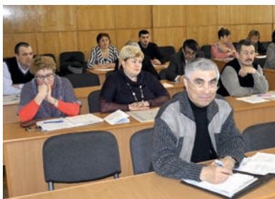
Заседание республиканского комитета Профсоюза