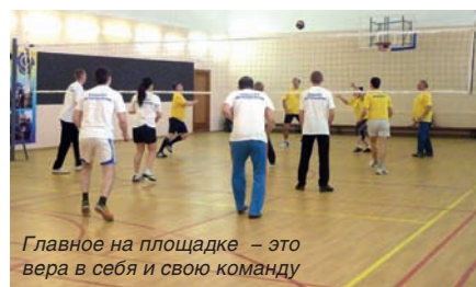
Главное на площадке – это вера в себя и свою команду

Руководитель Волгоградоблгостехнадзора поблагодарил областную организацию Профсоюза за большую работу по подготовке к проведению спартакиады. А также выразил надежду, что данное мероприятие послужит дальнейшему внедрению здорового образа жизни, улучшению физкультурно-оздоровительной и спортивной работы в трудовых коллективах, популяризации активных форм