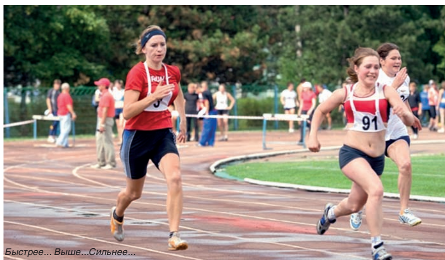
Быстрее... Выше... Сильнее...

Сегодня студенты и аспиранты Кубанского государственного агроуниверситета проживают в двадцати общежитиях студенческого городка. Для студентов дневной формы обучения эта потребность обеспечена на 88%. Каждый факультет занимает практически отдельное общежитие. В каждом общежитии имеется читальный зал для занятий студентов. В отдельных общежитиях и во всех учебных корпусах имеются буфеты, которые работают в течение учебного года, на территории студгородка работают две столовые