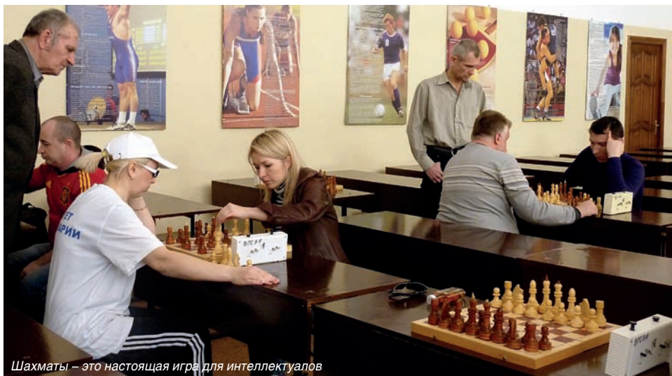
Шахматы – это настоящая игра для интеллектуалов

Спартакиада прошла как большой спортивный праздник, в котором приняли участие не только члены команд, но и трудовые кол-