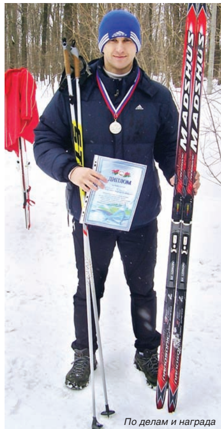
По делам и награда