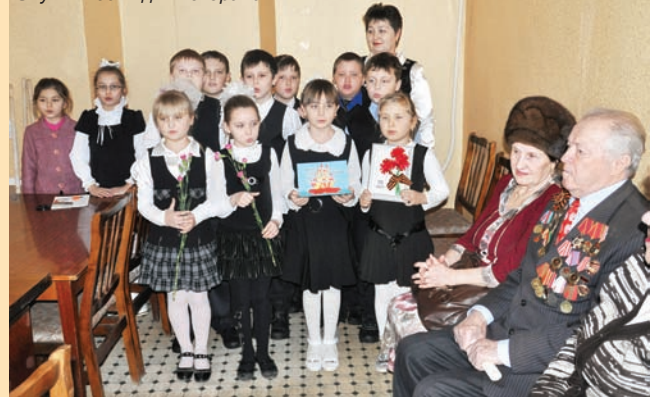
Звучит песня для ветеранов

70 лет со дня освобождения Старого Оскола и Старооскольского района от немецко-фашистских захватчиков