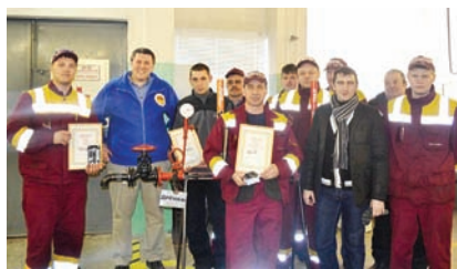
День безопасности прошел успешно!

циальная инвестиционная программа, в рамках которой внедряются лучшие международные стандарты по охране труда, промышленной и пищевой безопасности, экологии.