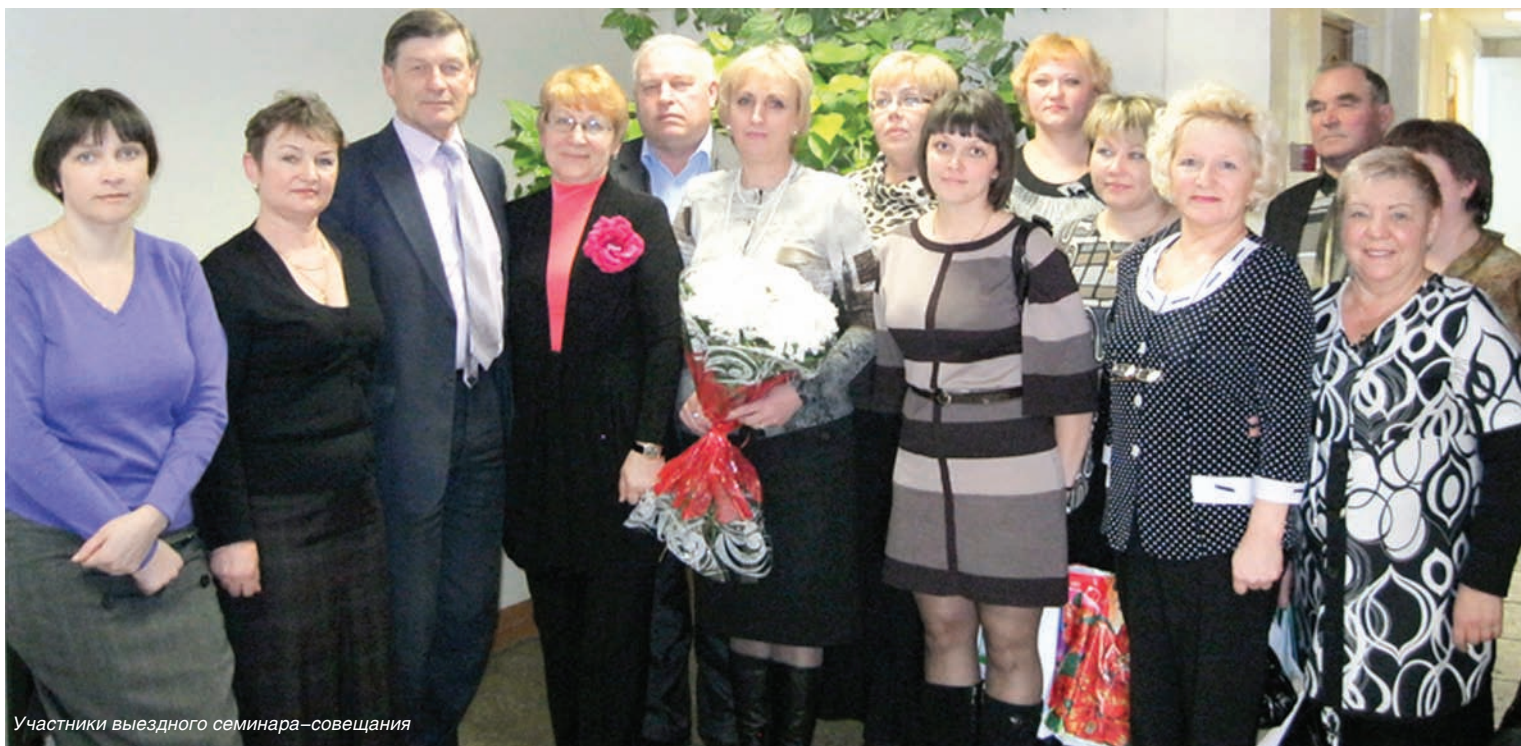
Участники выездного семинара-совещания