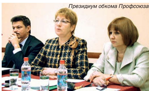
Президиум обкома Профсоюза

Оказывается юридическая помощь в написании исковых заявлений и иных