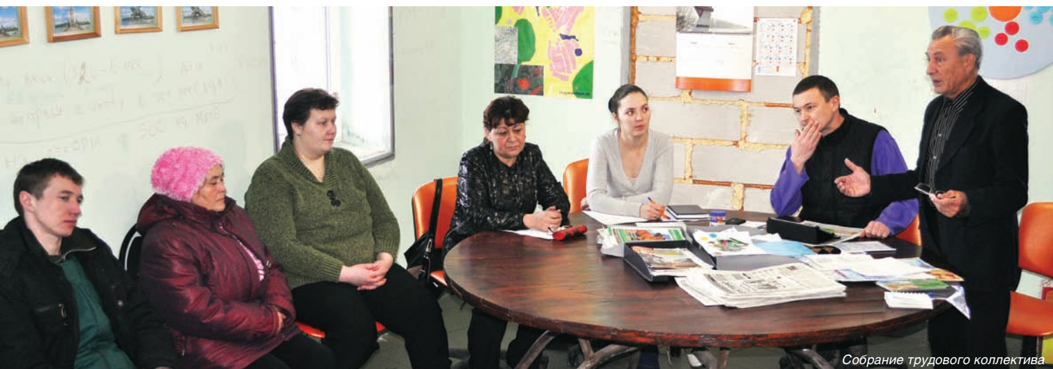
Собрание трудового коллектива