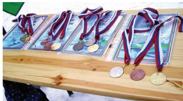
Награды ждут победителей