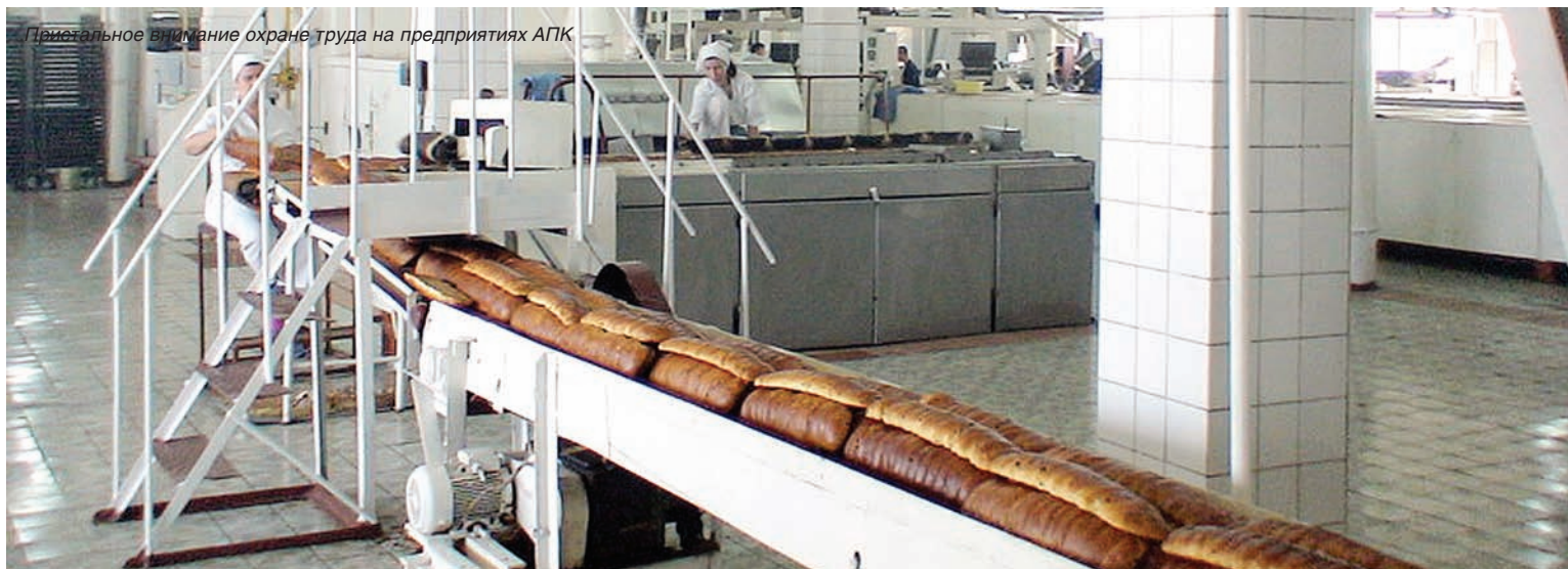
Пристальное внимание охране труда на предприятиях АПК