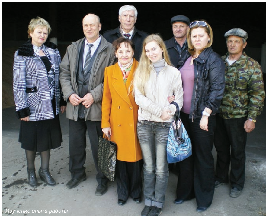
Изучение опыта работы

профсоюзной организации – обязательная норма. Это делает процесс аттестации рабочих мест более прозрачным и позволяет оперативно решать возникающие проблемы.