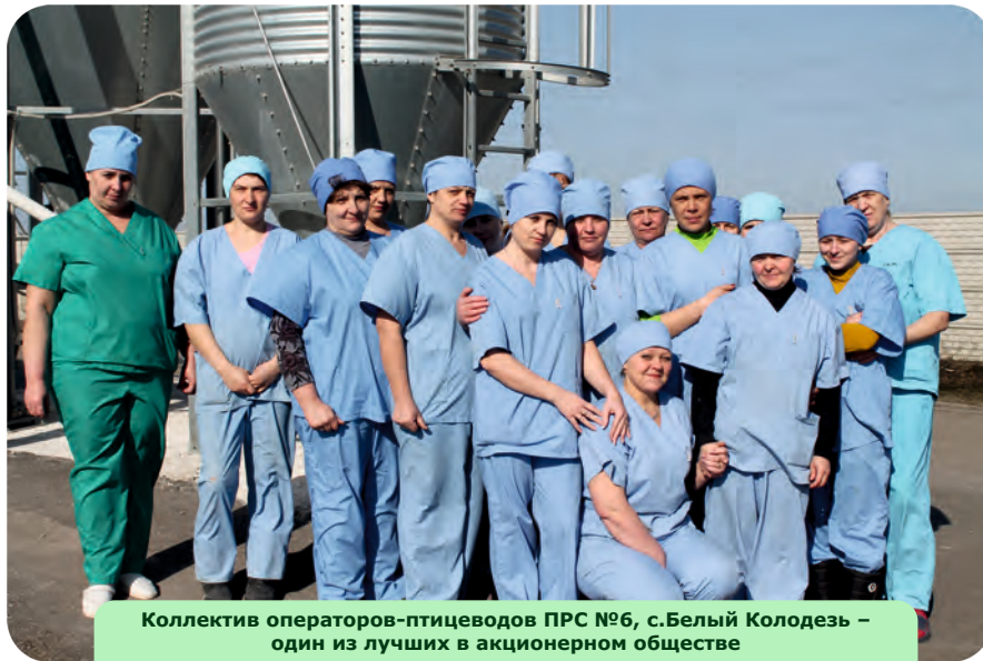
Коллектив операторов-птицеводов ПРС №6, с.Белый Колодезь – один из лучших в акционерном обществе