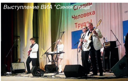
Выступление ВИА «Синяя птица»

к своей работе. Каждая профессия важна, почетна и нужна. И те, кто в тот день был награжден, люди талантливые, творческие, активные, пользующиеся заслуженным авторитетом среди своих коллег, по праву могут гордиться почетным званием «Человек Труда»: