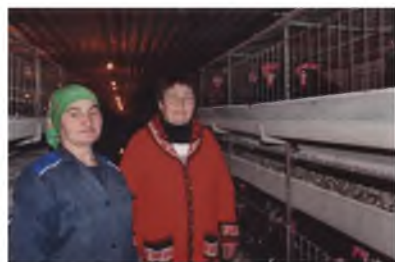
Выращивание кур московской черной породы

Первоначально хозяйство имело посевную площадь 420 га, в том числе зерновых – 230 га, бобовых – 30 га, картофеля и овощей – 60 га. Урожайность зерновых составляла 4-5 ц/га. В животноводстве было: КРС – 110 голов, в т.ч. коров – 31; свиней – 120 голов; лошадей – 40 голов; пчелосемей – 13. Среднегодовой надой на 1 фуражную корову составлял 1600 кг. Хозяйство имело четыре автомашины, четыре трактора и два комбайна. Стоимость основных средств составляла 36 тысяч рублей. Численность рабочих и служащих – 85 человек. Средняя зарплата 35-40 рублей в месяц.