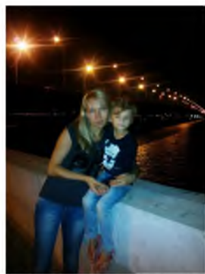
Прогулка по набережной