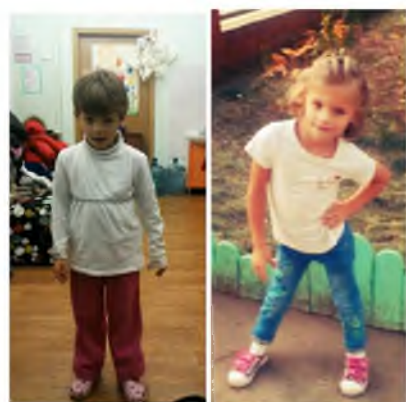
В детском доме и дома