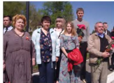
Профсоюз принимает участие в праздновании 75-летия Победы