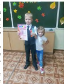
С братом сверстником

На пригорке кудрявая ива Белый ключ бьет под желтой горой Люди!, будьте добры и красивы Не губите природы живой.