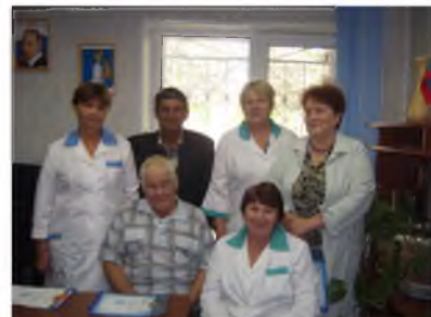
Члены профсоюза и ветераны ветеринарной службы