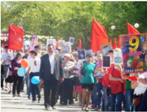
Празднование 9 мая - Дня Победы